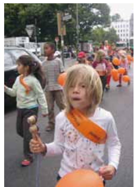
Kita-Demo - Mehr Zeit für Kids