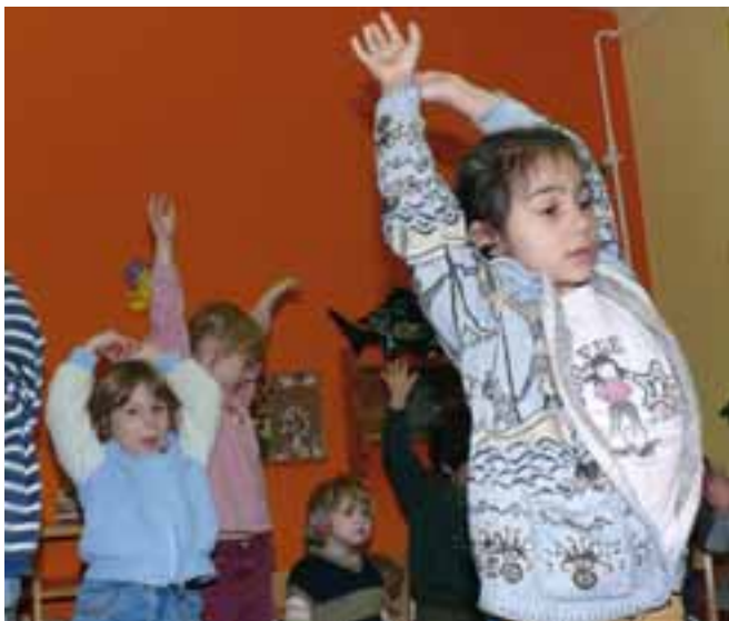
Sich bewegen, lernen wie von selbst

beit bildet hierzu ein wichtiges Fundament, sei es durch die Möglichkeit der oft unterschätzten „Tür- und Angel-Gespräche“, durch die regelmäßig stattfindenden Entwicklungsgespräche mit den Eltern oder durch aktualisierte Aushänge und Elternbriefe.