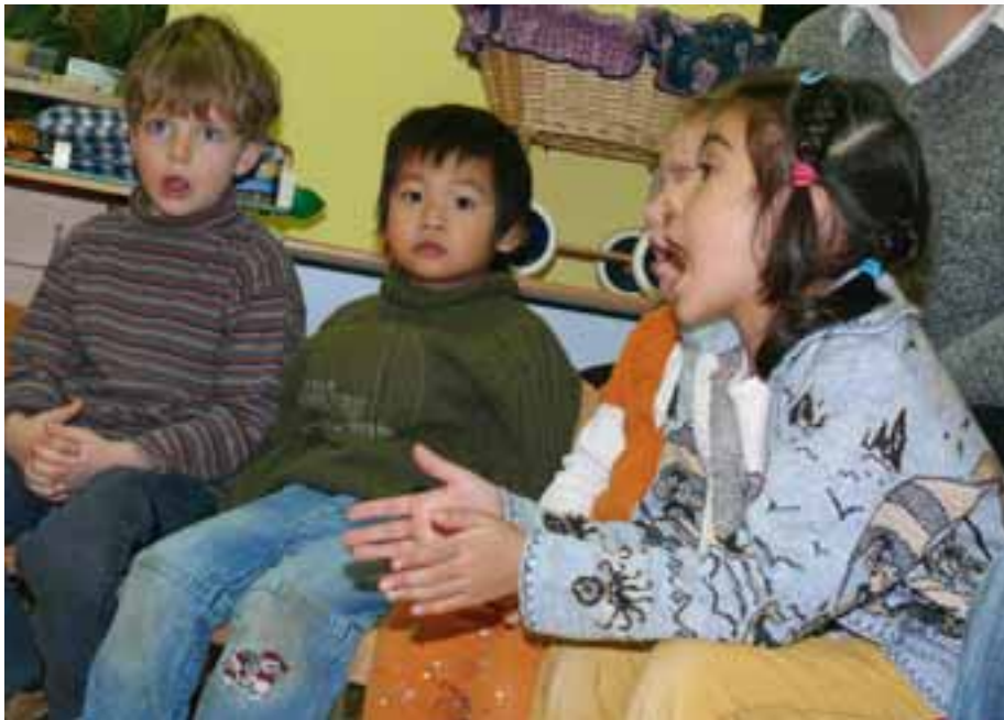
Reden und Zuhören_ Kita Spatzenhausen Boot e.V.