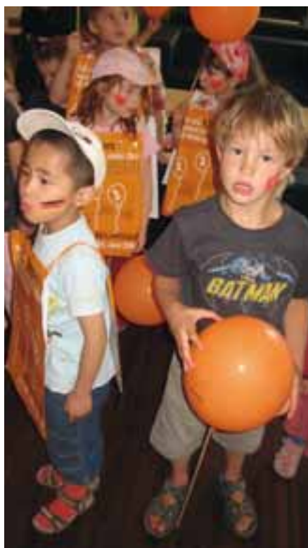
Kita-Aktionstag im Juli 2008

PARITÄTISCHE Träger von Kindertagesstätten 26