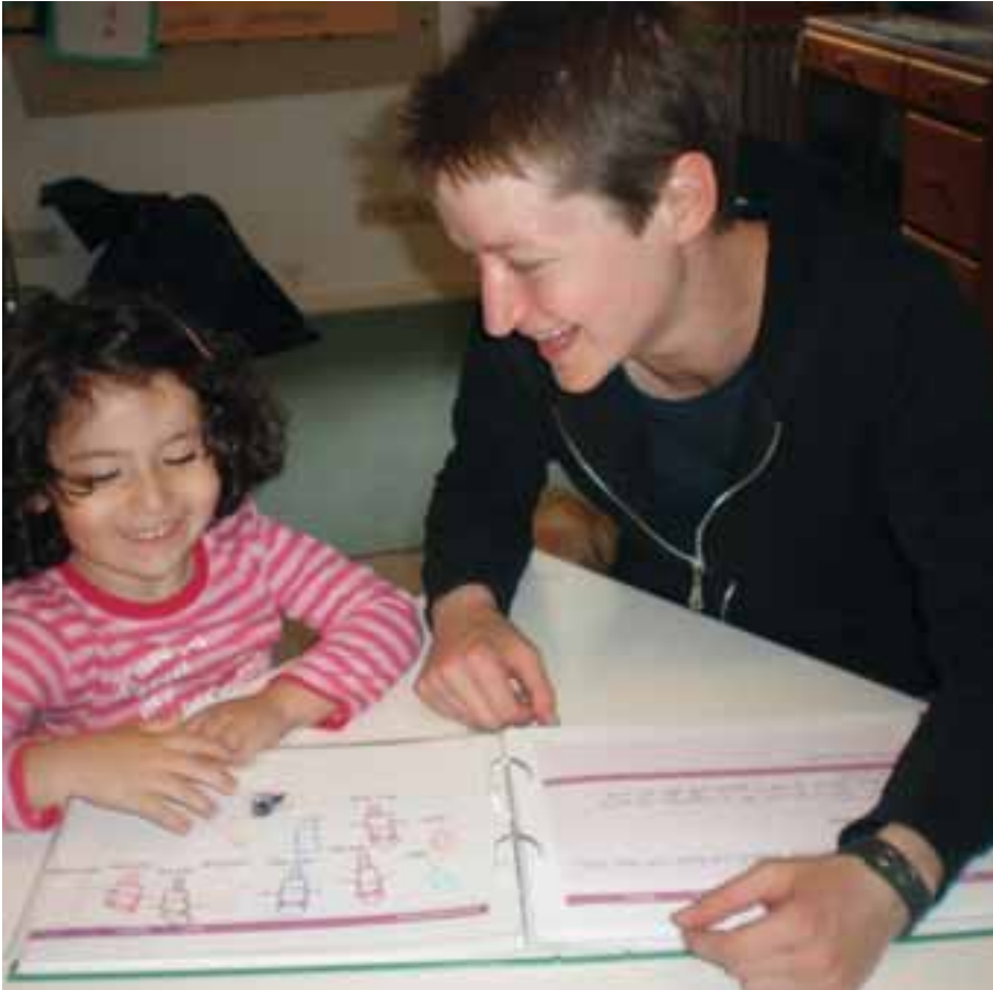
Mit dem Sprachlerntagebuch arbeiten

von Liedern, dem Erzählen von Erlebnissen, dem Theaterspiel und der sich deutlich erweiternden Kommunikation miteinander, ihre sprachliche Kompetenz festigen.