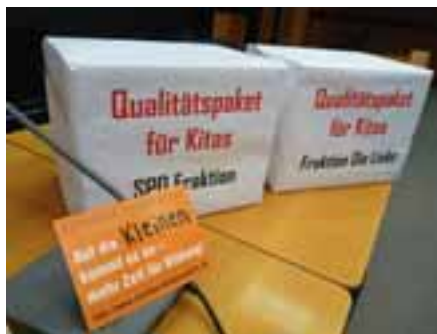
Diskussionsveranstaltung Kitabündnis