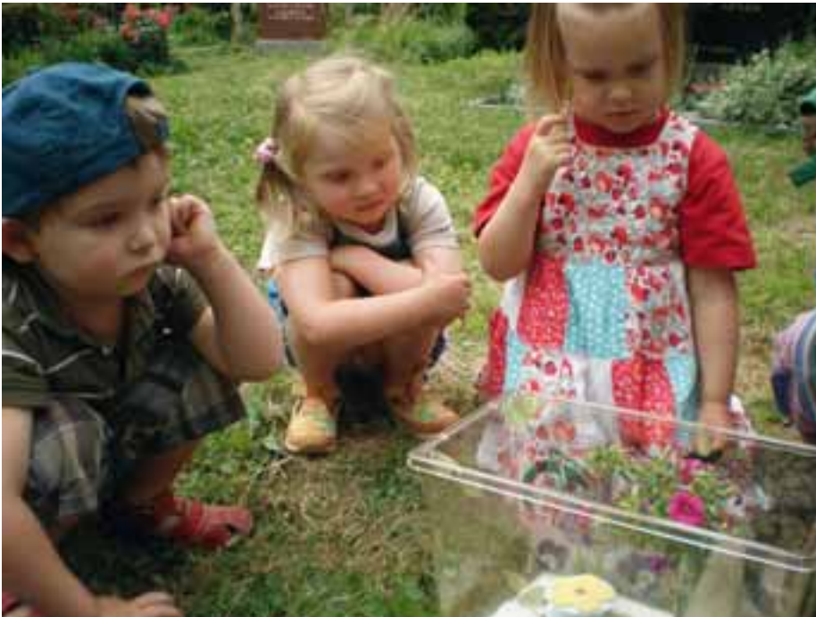
Von der Raupe zum Schmetterling