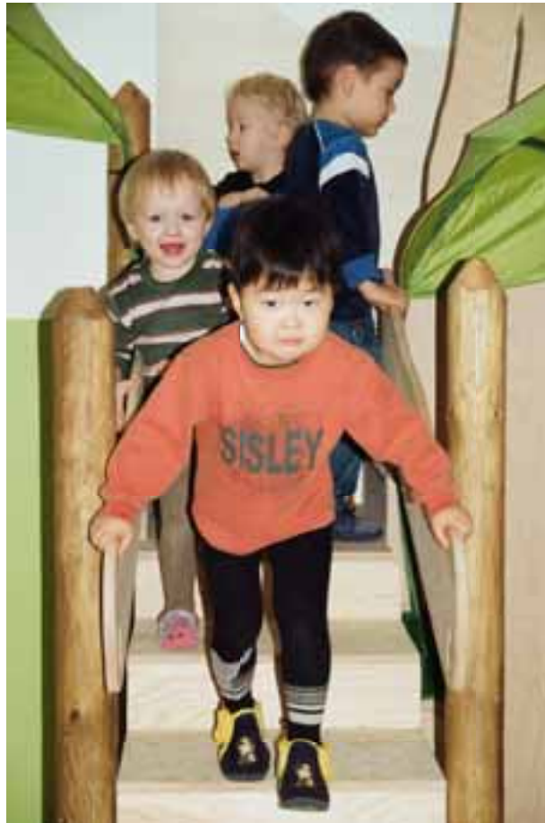
Neue Wege gehen: Kita Abenteuerwelten, Dialog e.V.