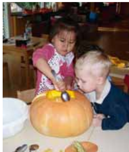
Gemeinsam entdecken und erfahren