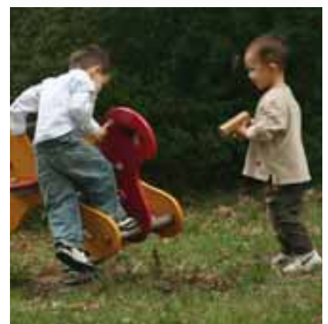
In Aktion

Sie haben ein großes Interesse an einer positiven Entwicklung ihrer Kinder. Durch die Teilhabe der Eltern können die Pädagogen mit ihnen in einen fairen und bereichernden Austausch treten, der sich als eine außerordentliche Unterstützung im Kita-Alltag erweist und sich positiv auf die Entwicklung des Kindes auswirkt. Dazu müssen Eltern angemessen von den Erzieher/innen begleitet werden: Das bedeutet, die Eltern zu den Beobachtungsinstrumenten zu informieren, ihnen Einsicht zu geben in die Dokumentationen und