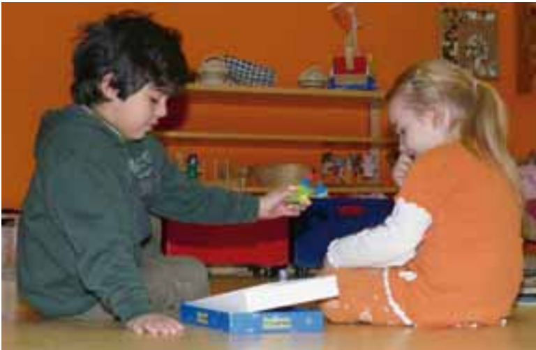
Gemeinsam ins Spiel vertieft

sich mit ihnen über das Wahrgenommene auszutauschen. In der Dokumentation der „Alltags- und Lerngeschichten“ der Kinder erfahren Eltern, welche Fragen und Themen ihre Kinder bewegen. So haben auch Eltern in der Kita oder zu Hause die Möglichkeit, über den Dialog mit den Kindern ihre Theorie von Welt gemeinsam zu konstruieren.