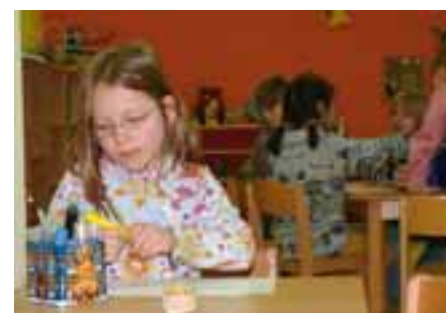
Still und konzentriert

Diese Überlegungen fließen in die sprachliche Förderung der Kinder in der Kita ein. Die Erzieherinnen der Jüngsten (ab etwa acht Wochen) begleiten sprachlich alle Handlungen mit dem Kind. Ob in der 1:1 Situation beim Wickeln, in der Essenssituation oder im Spiel. Durch die Beschreibung von Handlungen und Gegenständen in einfachen, jedoch nicht verniedlichenden Sätzen, erhält das Kind täglich sprachliche Muster von der ihm vertrauten Erzieherin. Beginnt das Kind selbst aktiv seine sprachlichen Möglichkeiten einzusetzen, so achtet die Erzieherin darauf, dass die sprachlichen Kontaktbemühungen nicht ins