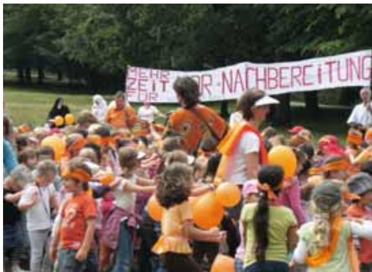
Kita-Demo - Mehr Zeit für Kids

verordnetenversammlung (BVV) Friedrichshain-Kreuzberg, dem Berliner Kitabündnis beizutreten mit folgender Begründung: „Die wichtigen Forderungen des Bündnisses nach ausreichend Zeiten für Erzieher/innen, genügend Personal in der Kita-Leitung, angemessene Gruppengrößen und einen Anspruch auf Teilzeitplätze auch ohne Prüfung des „Betreuungsbedarfs“ der Eltern sind unerlässlich für ein gutes Betreuungsangebot für Berliner Kinder zwischen null und sechs Jahren.“